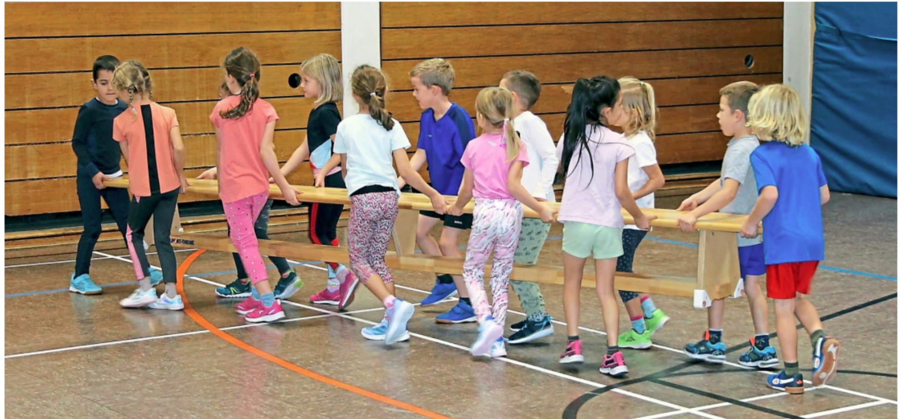
Wenn alle mithelfen, ist der Aufbau für das Bewegungsspiel schnell erledigt. Kooperation spielt beim Projekt „Bunter Ball“ eine entscheidende Rolle.