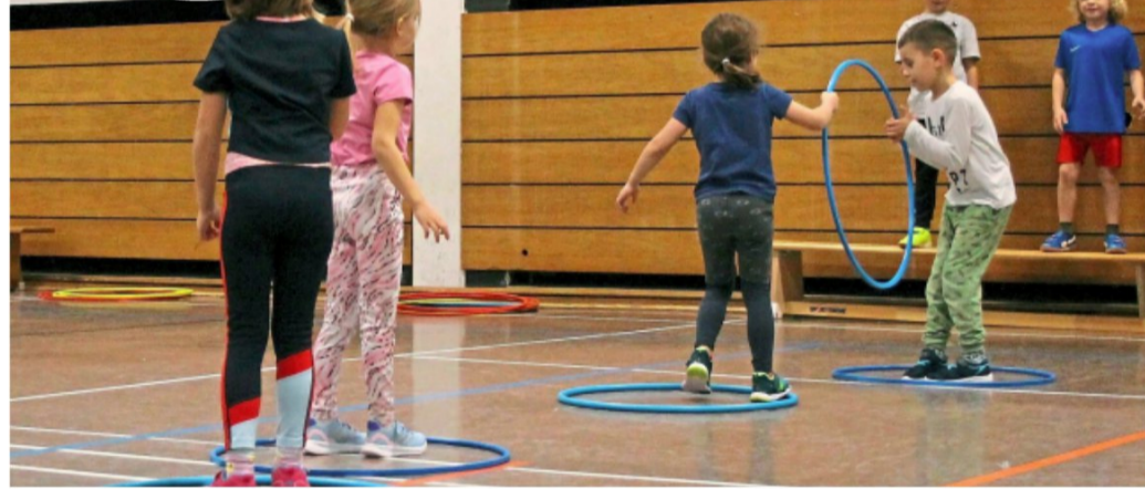
Nur im Team schaffen es alle „Affenkinder“ über den „Fluss“ auf die andere Seite. Vorab hatten an diesem Morgen fast alle Kinder zum gelben Ball gegriffen, um ihren Gemütszustand auszudrücken.